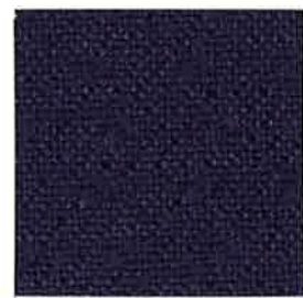
7044 Desert Night