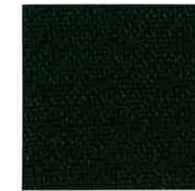
7034 Douglas Fur