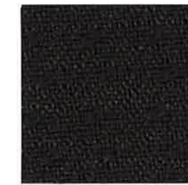
7047 Calcine Gray