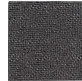
7004 Blue Steel