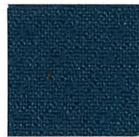
7005 Bright Blue